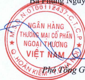
Phó Tổng Giám đốc